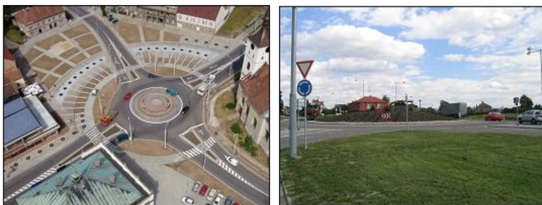
Obrázek 1: Příklady okružních křižovatek ze zkoumaného vzorku. Vlevo - Lázně Bohdaneč; vpravo - Ždírec

Zkoumaný vzorek obsahuje osm původně čtyřramenných průsečných křižovatek, které byly v letech 1998 - 2002 přestavěny na křižovatky okružní. Všechny křižovatky se nacházejí ve městech s počtem obyvatel menším jak 70 000.