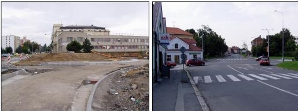
Obr.1 - Vybudovat okružní nebo světelně řízenou křižovatku? Anebo ponechat stávající stav? (Hranice a Čáslav, 2005)

Zdroje určené na financování realizace dopravně bezpečnostních opatření jsou omezené (lépe řečeno jsou velmi malé). Proto je důležité tyto omezené zdroje co nejefektivněji využívat. Tradičními kritérii při rozhodování o realizaci vhodného dopravně-bezpečnostního opatření je jeho legitimnost, vhodnost (dopravně inženýrská, občas bohužel i politická) a účinnost. Pro posuzování účinnosti dopravně-bezpečnostních opatření jsou k dispozici vhodné nástroje ( efficiency assessment tools - EATs ), pomocí kterých je možné vybrat mezi možnými opatřeními ty s nejvyšší mírou finanční návratnosti. Mezi nejdůležitější nástroje pro toto vyhodnocování patří analýza efektivity nákladů - CEA ( cost-efficiency analysis ) a analýza nákladů a přínosů - CBA ( cost-benefit analysis ).